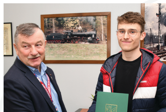
11 str. STYPENDIUM SPORTOWE