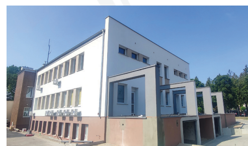
INWESTYCJE 18 str.